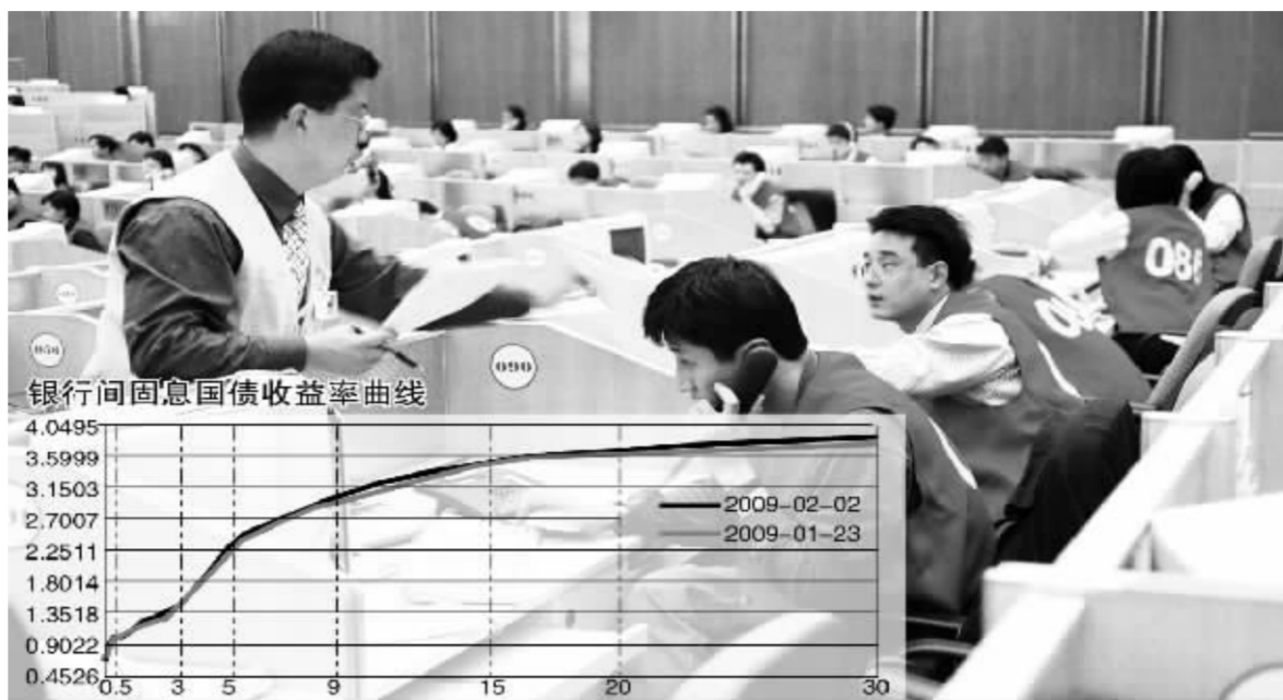
宽松的流动性并没有激活债券市场,投资者依然躲避中长期债 张大伟 制图

令债市整体重现强势格局,而是在温和中走出分化。由于流动性的回暖,当天以央行票据为首短端品种的交投状况明显好于节前。其中,一年以上的短期品种需求旺盛,由于主动卖盘有限,收市时一年央票的收益率水平较节前回落约2个基点,至1.14%;三个月央票则回落1个基点。同时,市场对短期信用品种的需求也开始上升。当天,尽管大部分短期融资券的成交收益率与节前基本持平,但是成交量却出现放大,成交期限则主要分布在一年附近或一个月以内的短期品种上。